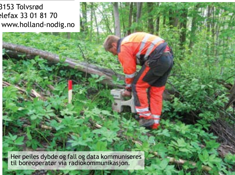
Her peiles dybde og fall og data kommuniseres til boreoperatør via radiokommunikasjon.