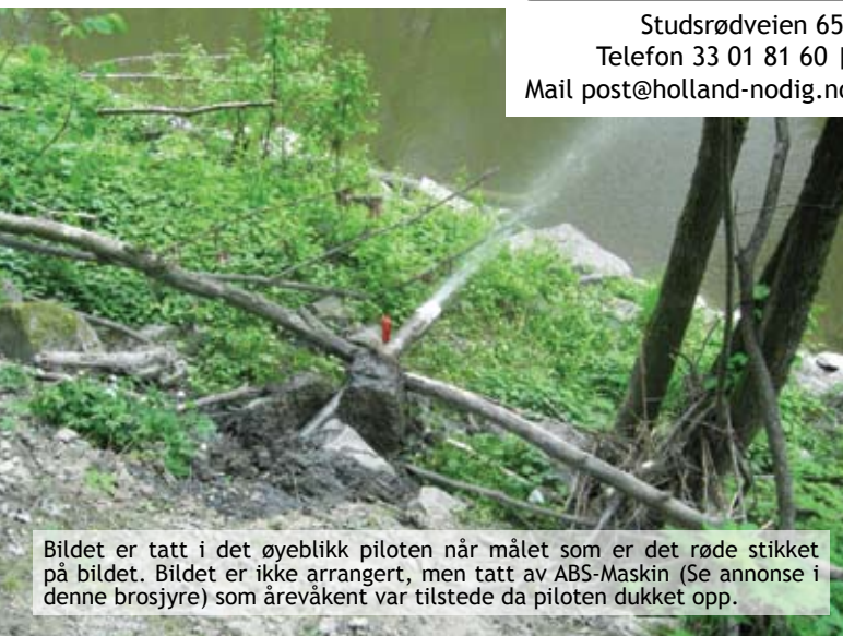
Bildet er tatt i det øyeblikk piloten når målet som er det røde stikket på bildet. Bildet er ikke arrangert, men tatt av ABS-Maskin (Se annonse i denne brosjyre) som årevåkent var tilstede da piloten dukket opp.

Studsørveien 65 | 3153 Tolvsrød Telefon 33 01 81 60 | Telefax 33 01 81 70 Mail post@holland-nodig.no | www.holland-nodig.no