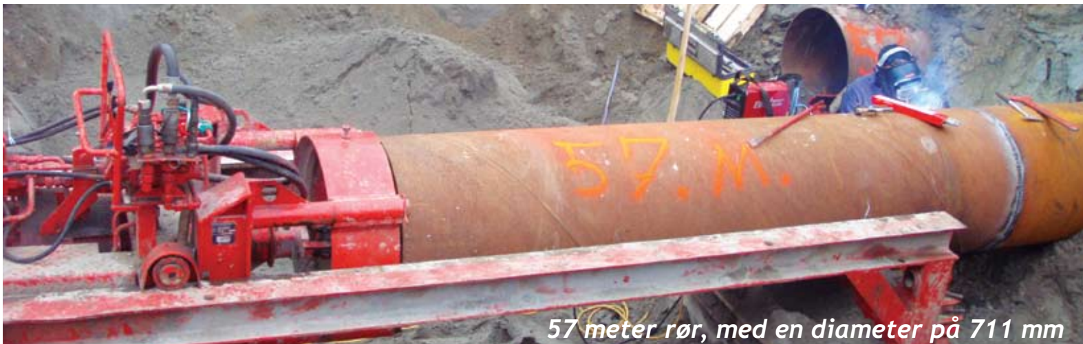
57 meter rør, med en diameter på 711 mm